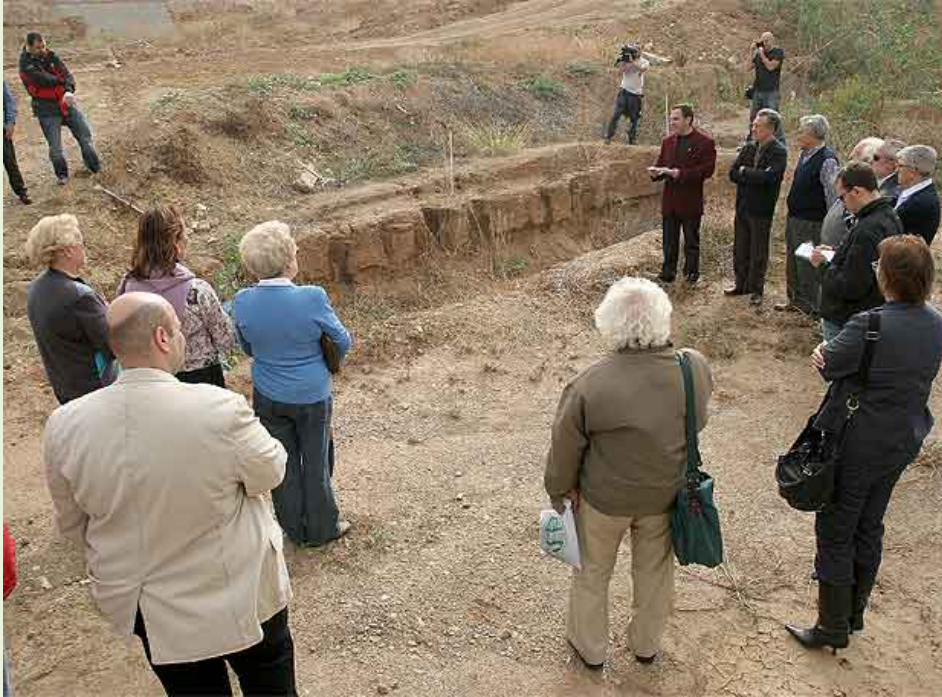
Fosa de Guardias Civiles fusilados por los golpistas en el cementerio de Málaga.